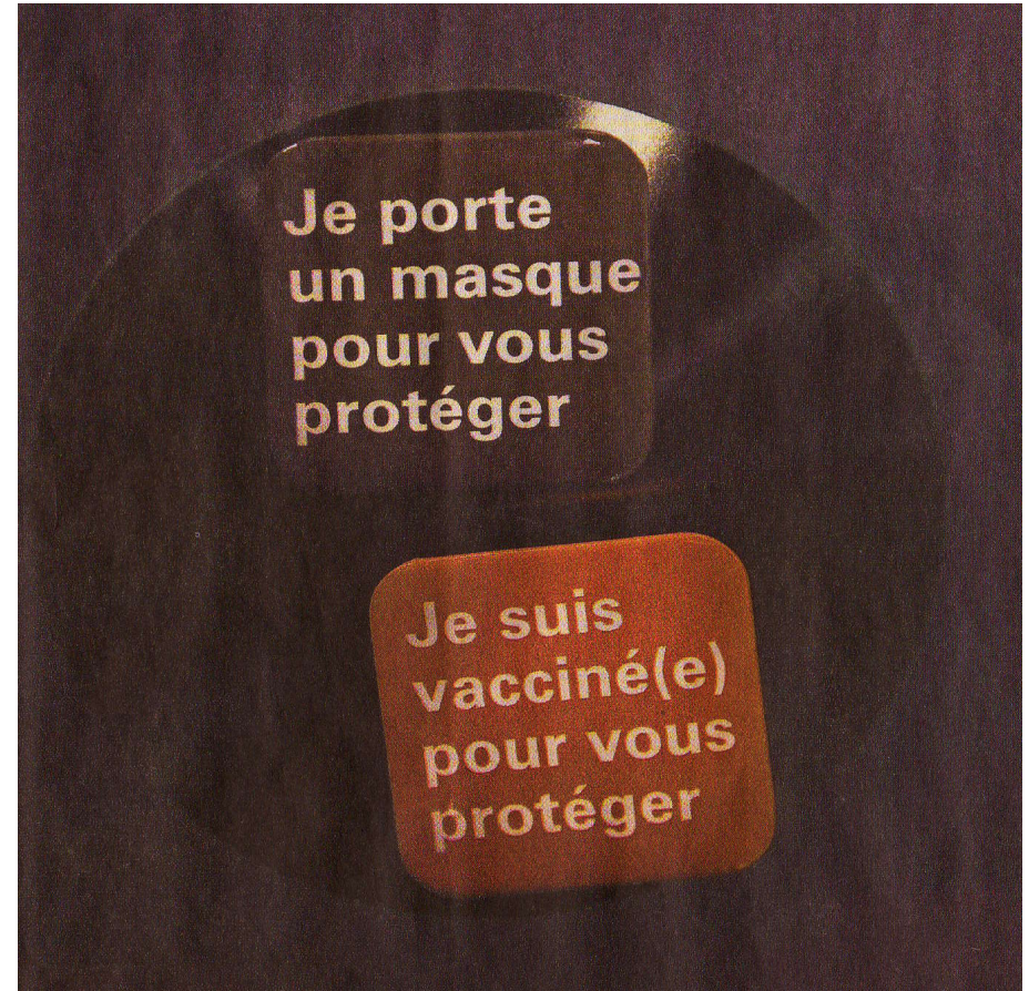
..» oder «Ich bin geimpft...»: Die zwei Pin-Varianten in Genf. Foto: Olivier Vogelsang («Tribu